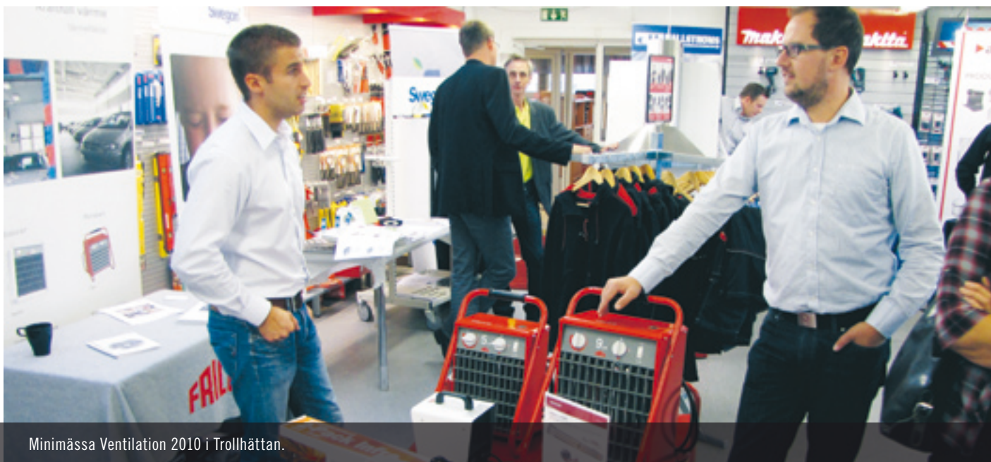
Minimässa Ventilation 2010 i Trollhättan.