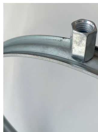
Kombinerad M8/M10 mutter