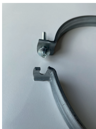
Sidoslitsad snabbblåsning (100-500 mm)