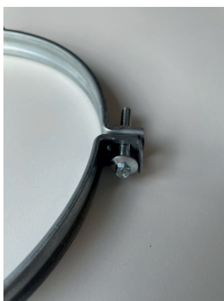
Flänsade 1/4" bultar med PH spår