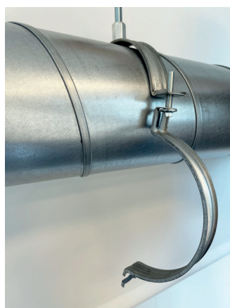
Extra stor öppningsvinkel